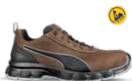
64.054.2 CONDOR BROWN LOW S3L ESD FO SR