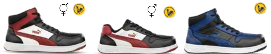
63.005.0 FRONTCOURT BLK/WHT/RED MID S3L ESD FO HRO SR 64.020.0 FRONTCOURT BLK/WHT/RED LOW S3L ESD FO HRO SR 63.007.0 FRONTCOURT BLUE/BLK MID S3L ESD FO HRO SR