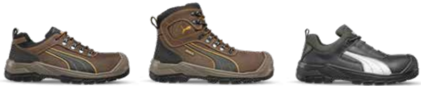
64.073.0 SIERRA NEVADA LOW S3 CI HI HRO SRC 63.022.0 SIERRA NEVADA MID S3 CI HI WR HRO SRC 64.072.0 CASCADES LOW S3 CI HI HRO SRC