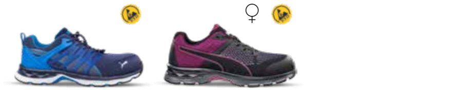
64.385.0 VELOCITY 2.0 BLUE LOW S1PS ESD FO HRO SR 64.392.0 DEFINE WNS LOW S1P ESD HRO SRC