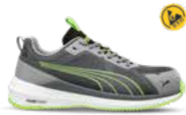
64.501.0 SLIDE GREY/GREEN LOW S1PS ESD FO HRO SRC