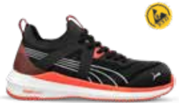
64.502.0 TURBO BLACK/RED LOW S1PS ESD FO HRO SR