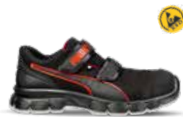
64.089.1 AVIAT LOW S1PL ESD FO SR