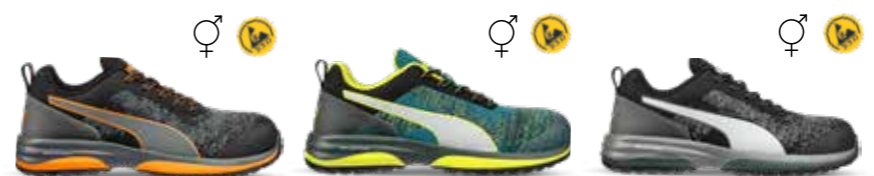
64.455.0 CHARGE ORANGE LOW S1P ESD HRO SRC 64.452.0 CHARGE GREEN LOW S1P ESD HRO SRC 64.454.0 CHARGE BLACK LOW S1P ESD HRO SRC