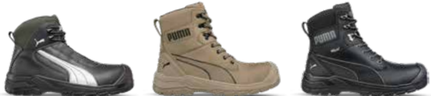
63.021.0 CASCADES MID S3 CI HI HRO SRC 63.074.0 CONQUEST STONE HIGH S3 CI HI HRO SRC 63.073.0 CONQUEST BLK CTX HIGH S3 CI HI WR HRO SRC