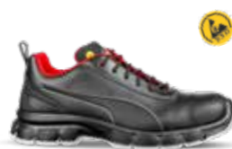
64.052.1 CONDOR BLACK LOW S3L ESD FO SR