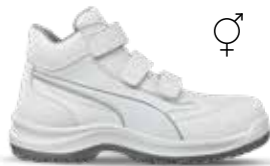
63.018.2 ABSOLUTE MID S2 SRC