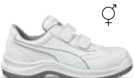
64.064.2 ABSOLUTE LOW S2 SRC