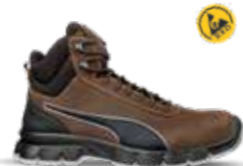
63.012.2 CONDOR BROWN MID S3L ESD FO SR