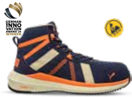
63.504.0 RIVAL BLUE/ORANGE MID S1PS ESD FO HRO SR