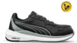
64.503.0 ZOOM BLACK LOW S3S ESD FO HRO SR