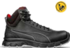
63.010.1 CONDOR BLACK MID S3L ESD FO SR