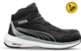
63.503.0 ZOOM BLACK MID S3S ESD FO HRO SR