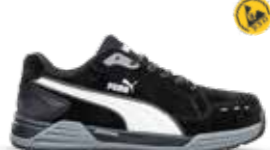
64.465.0 AIRTWIST BLACK LOW S3 ESD HRO SRC