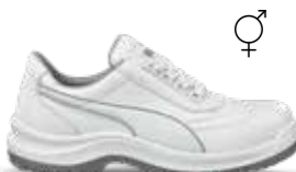
64.062.2 CLARITY LOW S2 SRC