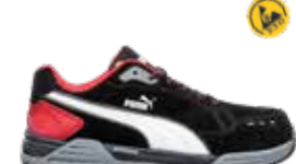
64.463.0 AIRTWIST BLK RED LOW S3 ESD HRO SRC