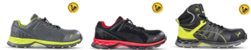
64.388.0 FUSE MOTION 2.0 GREEN LOW S1PS ESD FO HRO SR 64.389.0 FUSE MOTION 2.0 RED MID S1PS ESD FO HRO SR 63.388.0 VELOCITY 2.0 YELLOW MID S3S ESD FO HRO SR