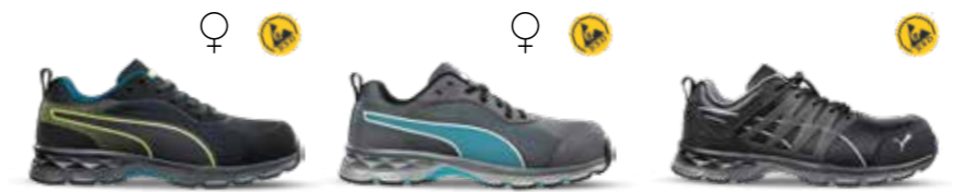
64.393.0 FUSE KNIT BLACK WNS LOW S1P ESD HRO SRC 64.390.0 FUSE KNIT BLUE WNS LOW S1P ESD HRO SRC 64.384.0 VELOCITY 2.0 BLACK LOW S3S ESD FO HRO SR