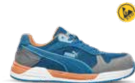
64.464.0 FRONTSIDE LOW S1P ESD HRO SRC