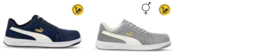
64.454.0 ICONIC NAVY LOW S1PL ESD FO HRO SR 64.454.0 ICONIC GREY LOW S1PL ESD FO HRO SR