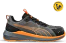
64.500.0 SLIDE GREY/ORANGE LOW S1PS ESD FO HRO SRC