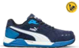
64.462.0 AIRTWIST BLUE LOW S3 ESD HRO SRC